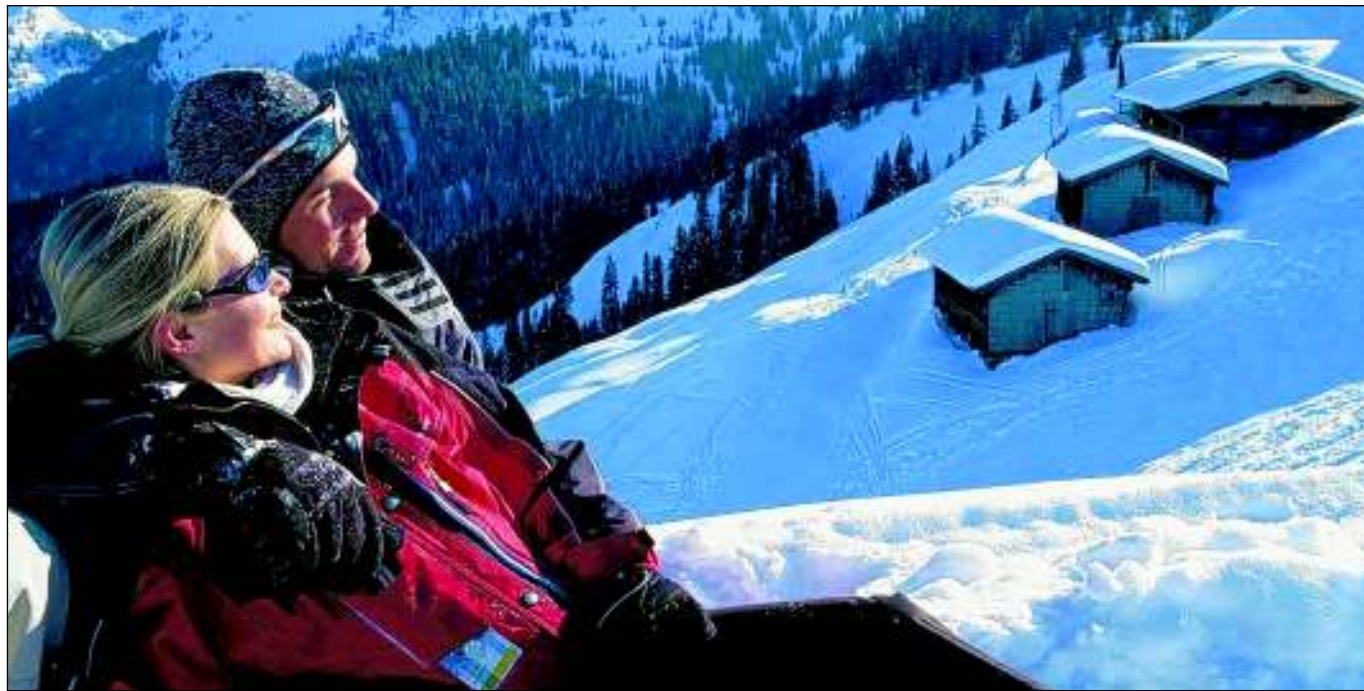
Auf Natur pur und gastfreundliche Tiroler treffen Urlauber in der Wildschönau.